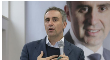
L'assessore regionale e candidato sindaco

CAMPAGNA ELETTORALE COPERTA E CONTROVOGLIA DI LEO. C'E' ANALISI, UN PO' DI VISIONE, MANCA IL "POPOLO"