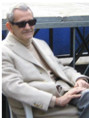
Il leader de "La Cicogna"

I volti emergenti della contesa di San Severo